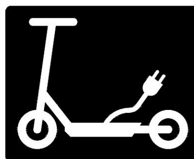
Σήμανση Οδοστρώματος Β

Επιτρεπόμενος χώρος διακίνησης Συσκευών Προσωπικής Κινητικότητας σε οποιαδήποτε πλατεία ή σε οποιοδήποτε πεζόδρομο.