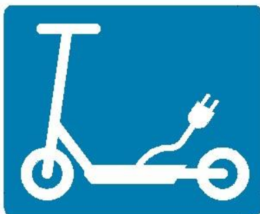
Σήμανση Οδοστρώματος Α

Ο ρ ι ζ ό ν τ ι α Σ ή μ α ν σ η γ ι α Σ υ σ κ ε υ έ ς Π ρ ο σ ω π ι κ ή ς Κ ι ν η τ ι κ ό τ η τ α ς